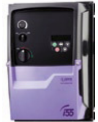
Größe 3 mit Schalter