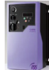
Größe 2 mit Schalter