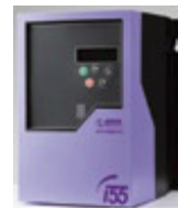
Größe 1 ohne Schalter